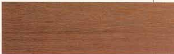
Lavorati artigianalmente a mano pezzo per pezzo, i listelli per il parquet hanno spessore totale di 16 mm, con uno strato di 5 mm di legno nobile. Misurano 19x180/200 cm. Atelier Plank 190 Michelangelo Biancopera, in finitura rovere di Fontaines, di Listone Giordano, posa esclusa, al mq costa 148,08 euro.