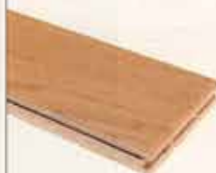
Il parquet prefinito in rovere massello, spessore 14 mm, ha i listelli che misurano 9x30/100 cm. Teknomass di Bruno, al mq, Iva esclusa, costa 75,00 euro.