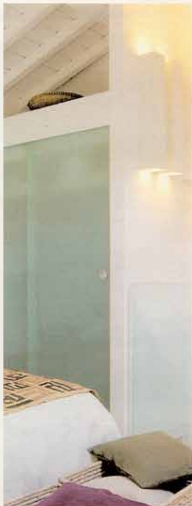
Nel sopralco, l'illuminazione artificiale è risolta con lampade a risparmio energetico su cui sono montati portalampade in lamiera verniciata. Questa zona, a sua volta, fornisce luce al bagno sottostante attraverso un inserto in cristallo realizzato nel pavimento.