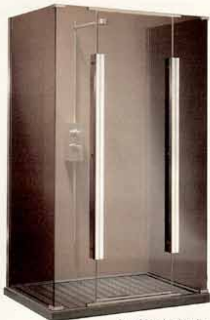
La cabina doccia adatta per l'installazione al centro della parete ha profili in alluminio e pannelli in cristallo temperato. Acquarium di Calibe misura 100x70px190h cm. Costa 2.232,00 euro.

Ha i pannelli in cristallo temperato trasparente il box doccia completo di rubinetteria termostatica, asta doccia, 6 jet idromassaggio. Il piatto in Tecnorit è completo di due sedili rialzabili. Talos Integra di Hafro misura 160x80px210h cm. Costa 11.800,00 euro.