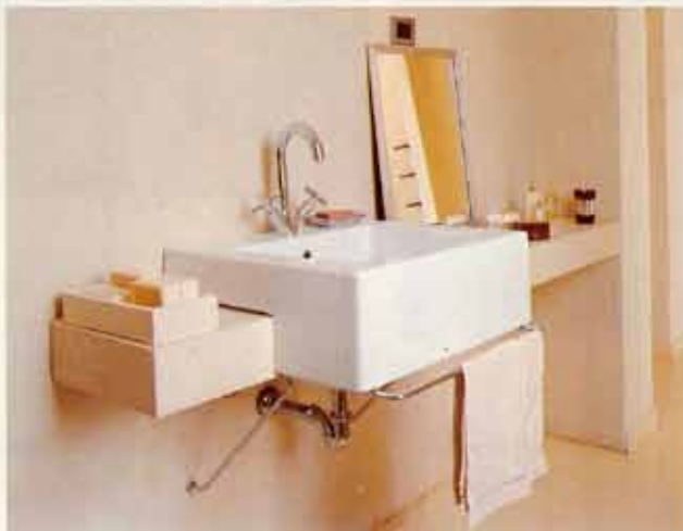
Il lavabo a semincasso esiste anche nella versione sospesa, da incasso o da appoggio. Misura 60x55 cm. Acquagrande di Ceramica Flaminia costa 440,00 euro.